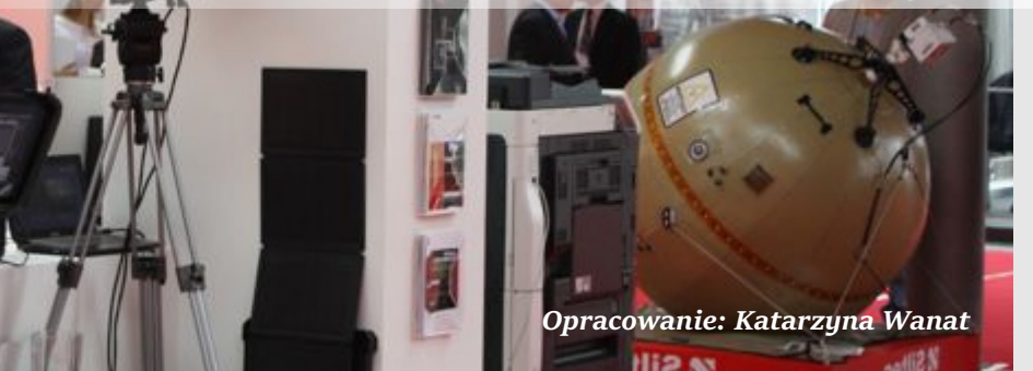
Opracowanie: Katarzyna Wanat

Po raz kolejny kieleckie targi potwierdziły swoją renomę i stały się areną, na której goście mieli możliwość obejrzyć dobrze już znane produkty polskiej i zagranicznej zbrojeniówki. Nie zabrakło nowości. Jedną z nich była nasza kamera dalekiego zasięgu DNF-100. Firma Eltrac System po raz pierwszy demonstrowała swoje rozwiązanie na kieleckiej wystawie, a prezentowana kamera wzbudziła zainteresowanie zarówno polskich, jak i zagranicznych gości targów.