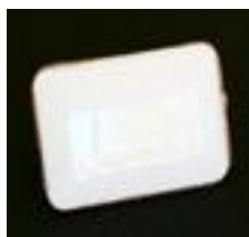
zaślepka bez otworu (0960) z otworem (0961)