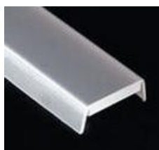
osłonka typu HS mleczna (1369) przezroczysta (1370)