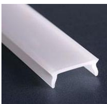
osłona typu K / KA-BIS mleczna (1547/17071) przezr. (1548/17072) osłona typu LIGER mleczna mat. (17031)